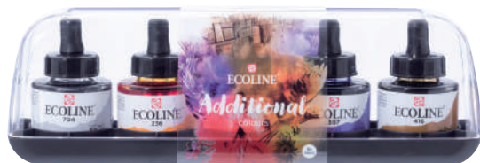
アディショナル5色セット