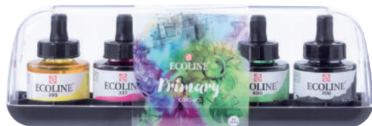
プライマリー5色セット